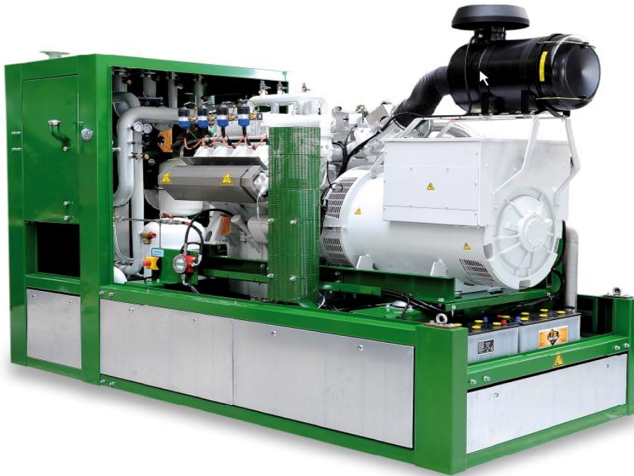
Рис.: Символическое изображение, может отличаться от описанного модуля

Готовая к подключению компактная блочная тепло-электроцентраль состоит в основном из следующих узлов: