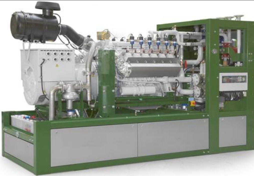
Рис.: Символическое изображение, может отличаться от описанного модуля

Готовая к подключению компактная блочная тепло-электроцентральный состоит в основном из следующих узлов: