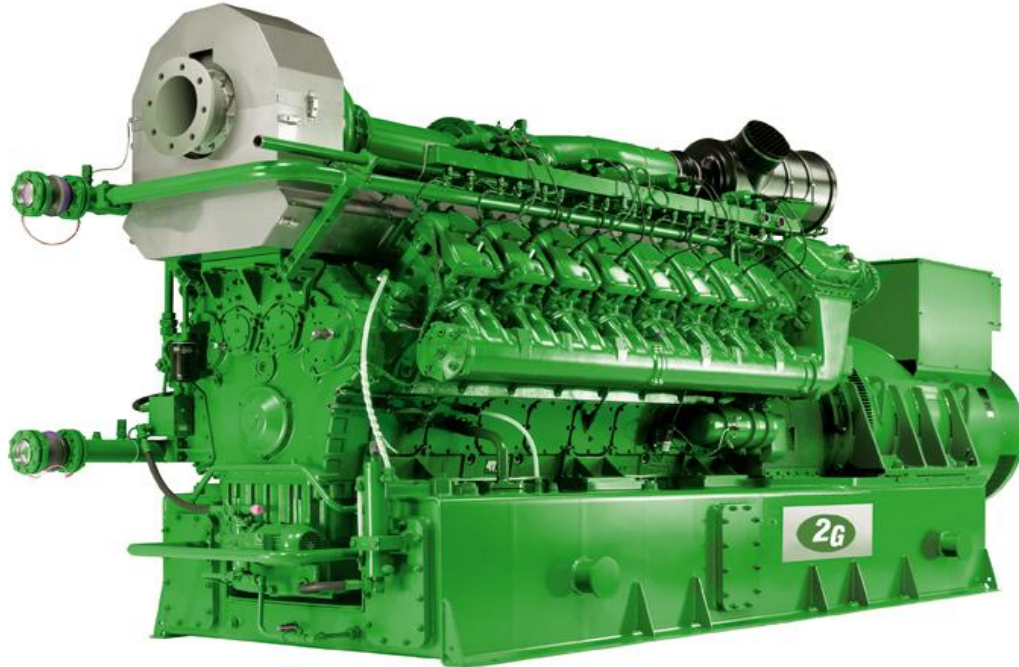
Рис.: Символическое изображение, может отличаться от описанного модуля